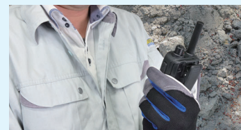
現場での操作性を考慮

・LCD画面が大きくなり視認性・操作性が向上 ・Bluetooth機能やUSB充電機能で利用シーン拡大 ・手袋での利用時にも保持しやすいボディデザイン