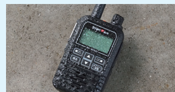
屋外使用を想定した試験を実施