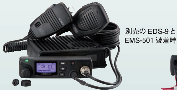
別売の EDS-9 と EMS-501 装着時