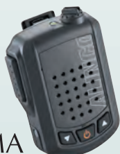
ワイヤレス・スピーカーマイク 音声出力3W EMS-87B