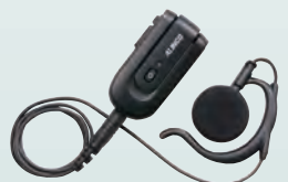
ワイヤレス・イヤホンマイク EME-80BMA