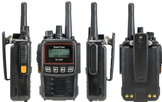
ドコモビジネスランシーバ認定品