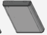
大容量 5800mAh リチウムイオン 電池パック* BT000593A01