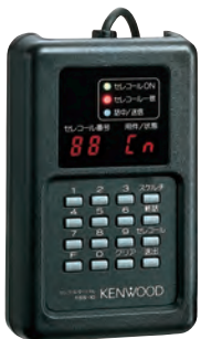
セレコールターミナル TSS-10