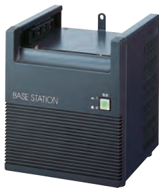
ベースステーション(基地局用) KBS-1