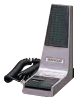
スタンドマイク スタンドマイクは受注生産での対応となります。 弊社無線システム営業部にご相談ください。 Tel:045-443-3122