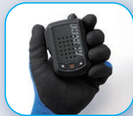
ワイヤレススピーカーマイクは大音量、騒音下でもよく聞こえます。