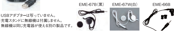
※USBアダプターは写っていません。 ※充電スタンドに無線機は付属しません。 無線機は同じ充電器が使える別の製品です。