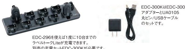
EDC-296を使えば1度に10台までのラベルトークLiteが充電できます。別売の充電セットEDC-300Kが必要です。

販売店またはサービスセンターにご相談ください。法律によりユーザーが技術無線機を分解することは禁じられています。